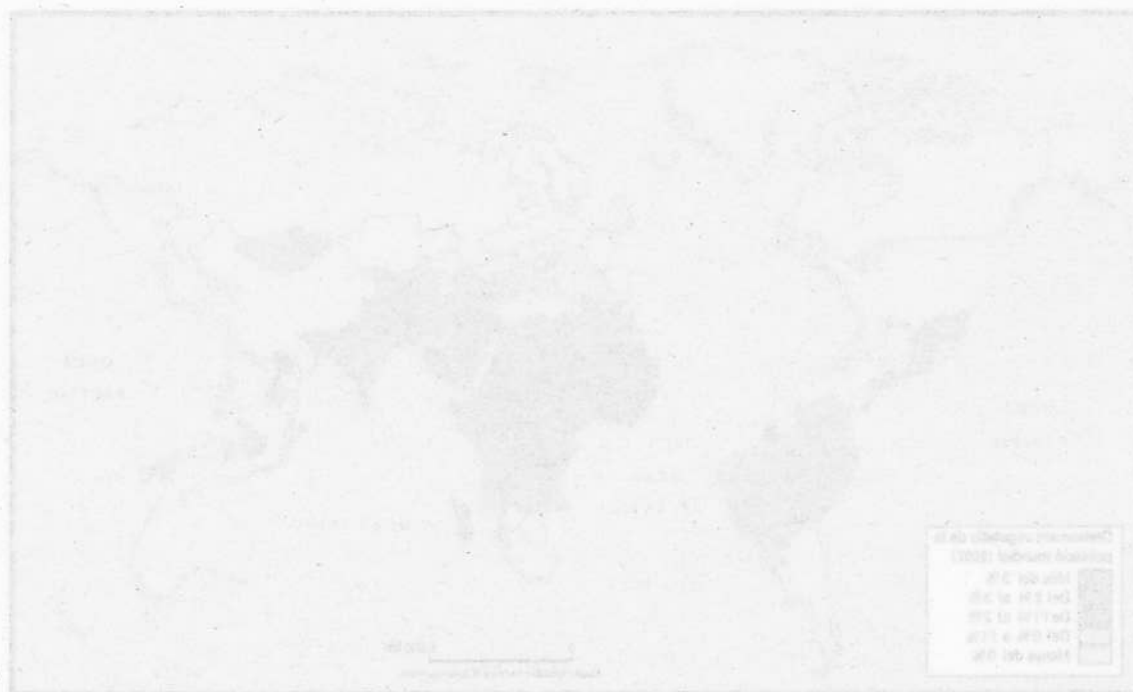
Font: Geografia. 2a Edició. Barcelona: Barcelona, 2009.

1. Descriu la informació que proporciona el mapa.